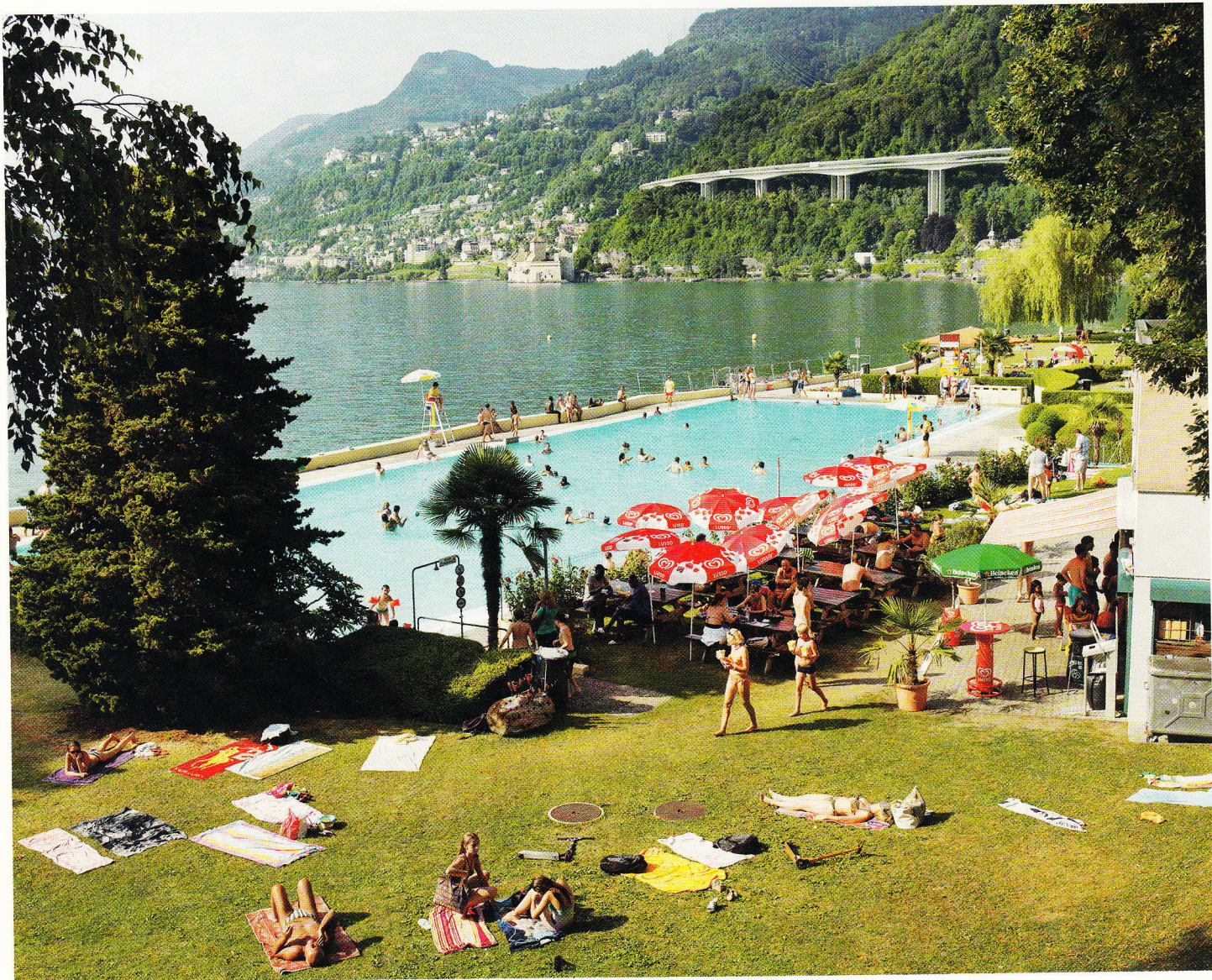
^ Villeneuve, piscine communale et lac Léman, Suisse, 2013. > Le Petit Rhône, Le Reculat, Saintes-Maries-de-la-Mer, 2011.