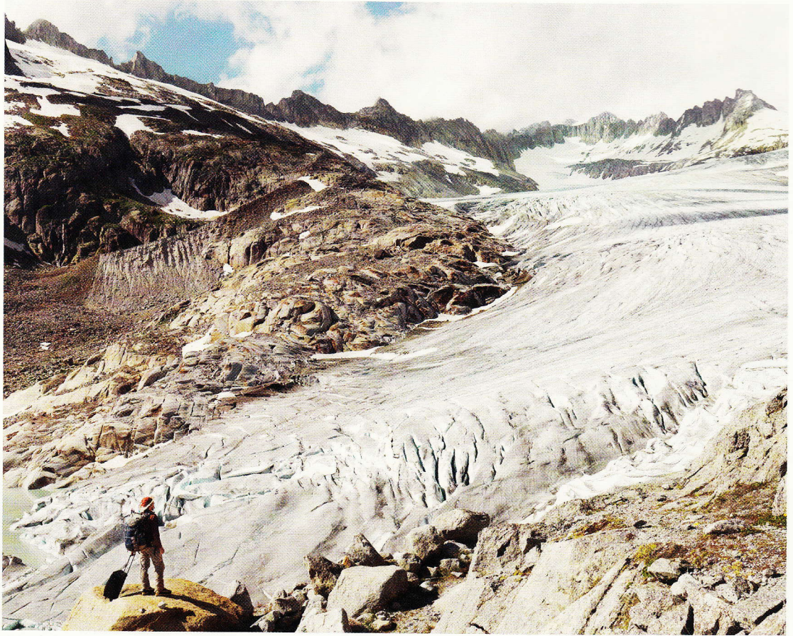
Rhodanie - Du glacier du Rhône à la mer Méditerranée. ^ Oberwald, glacier du Rhône, Suisse, 2013. v Viaduc du TGV, Avignon, 2011.