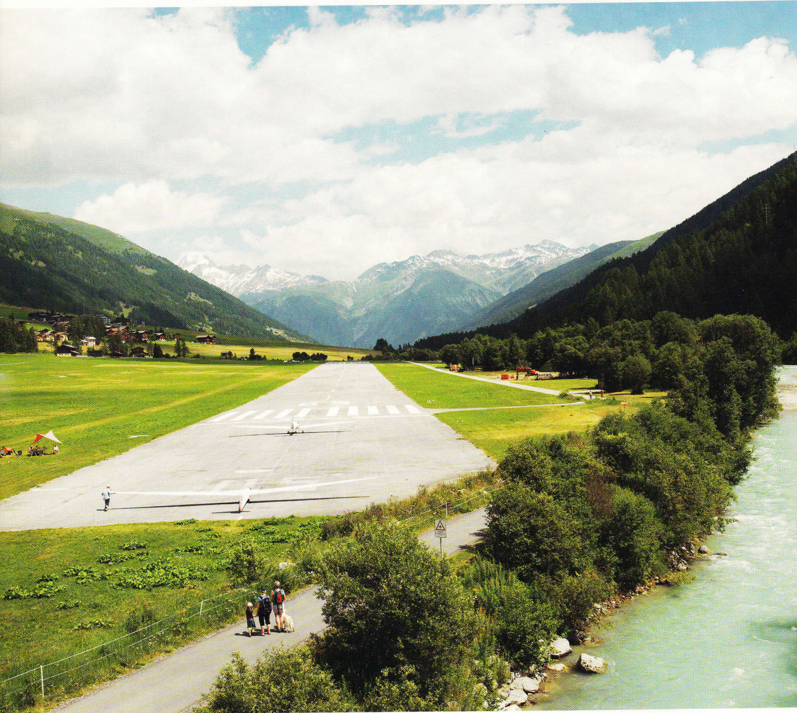
^ Münster, aérodrome, Suisse, 2013.