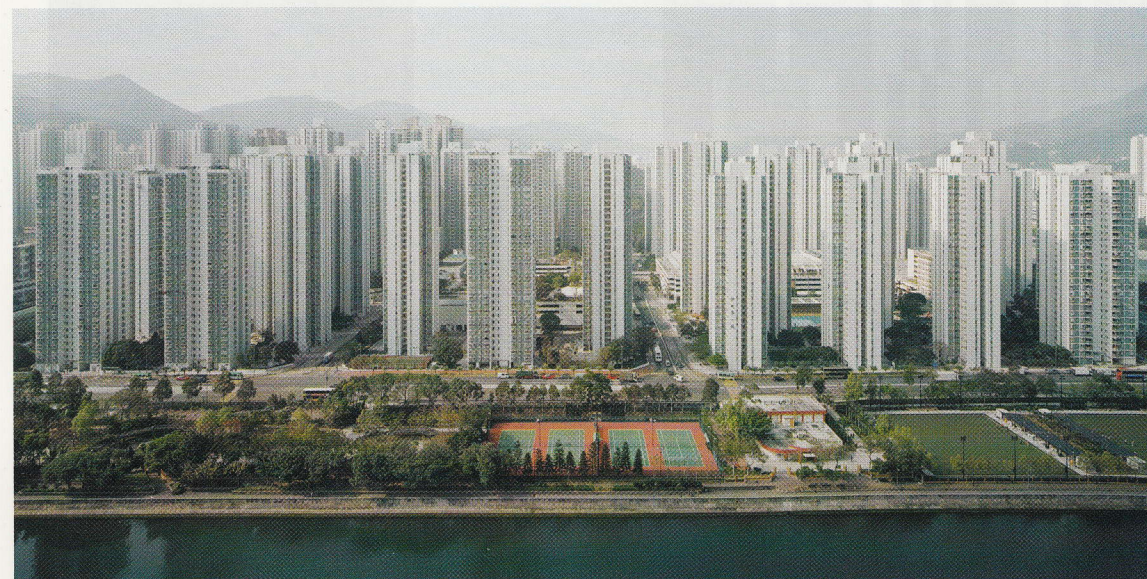
> Cinéma Étoile Lilas, Hardel & Le Bihan Architectes, 2013.