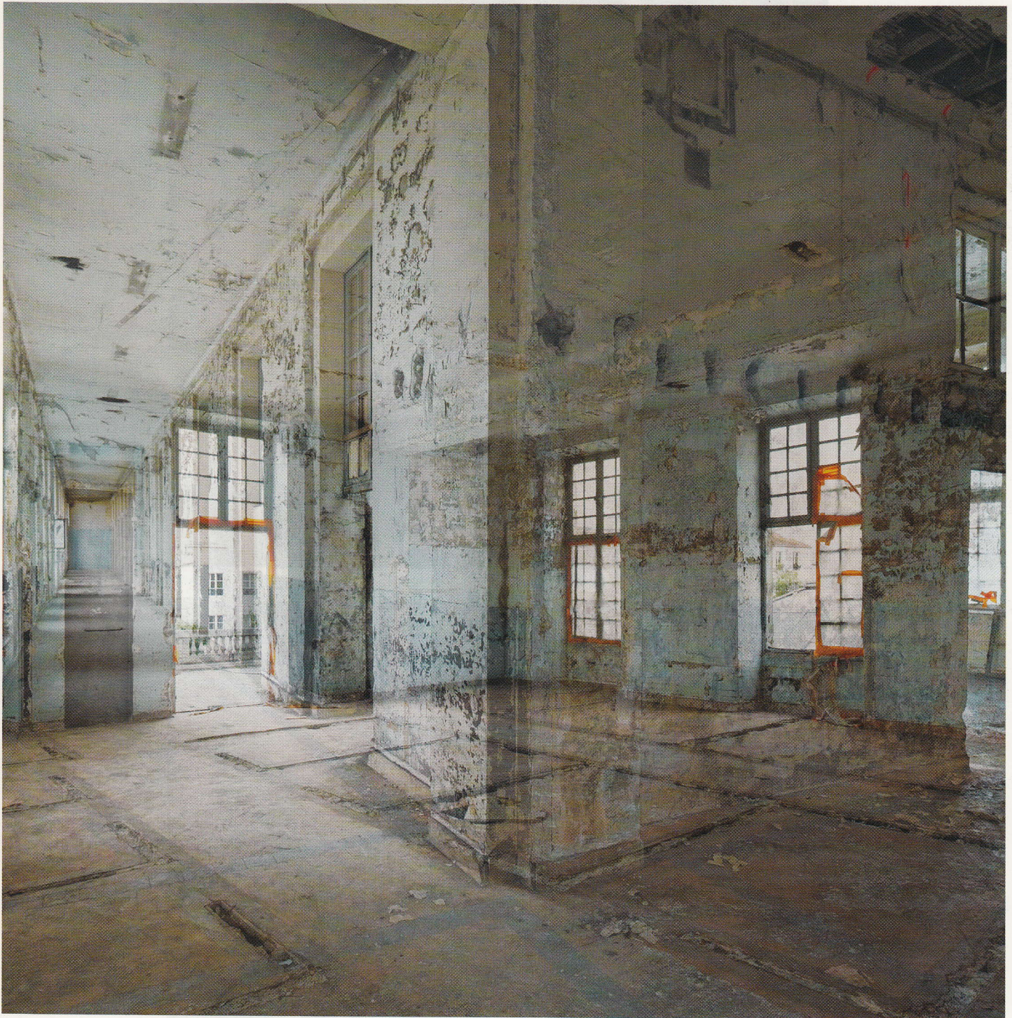
entre-deux, #14, 2012.