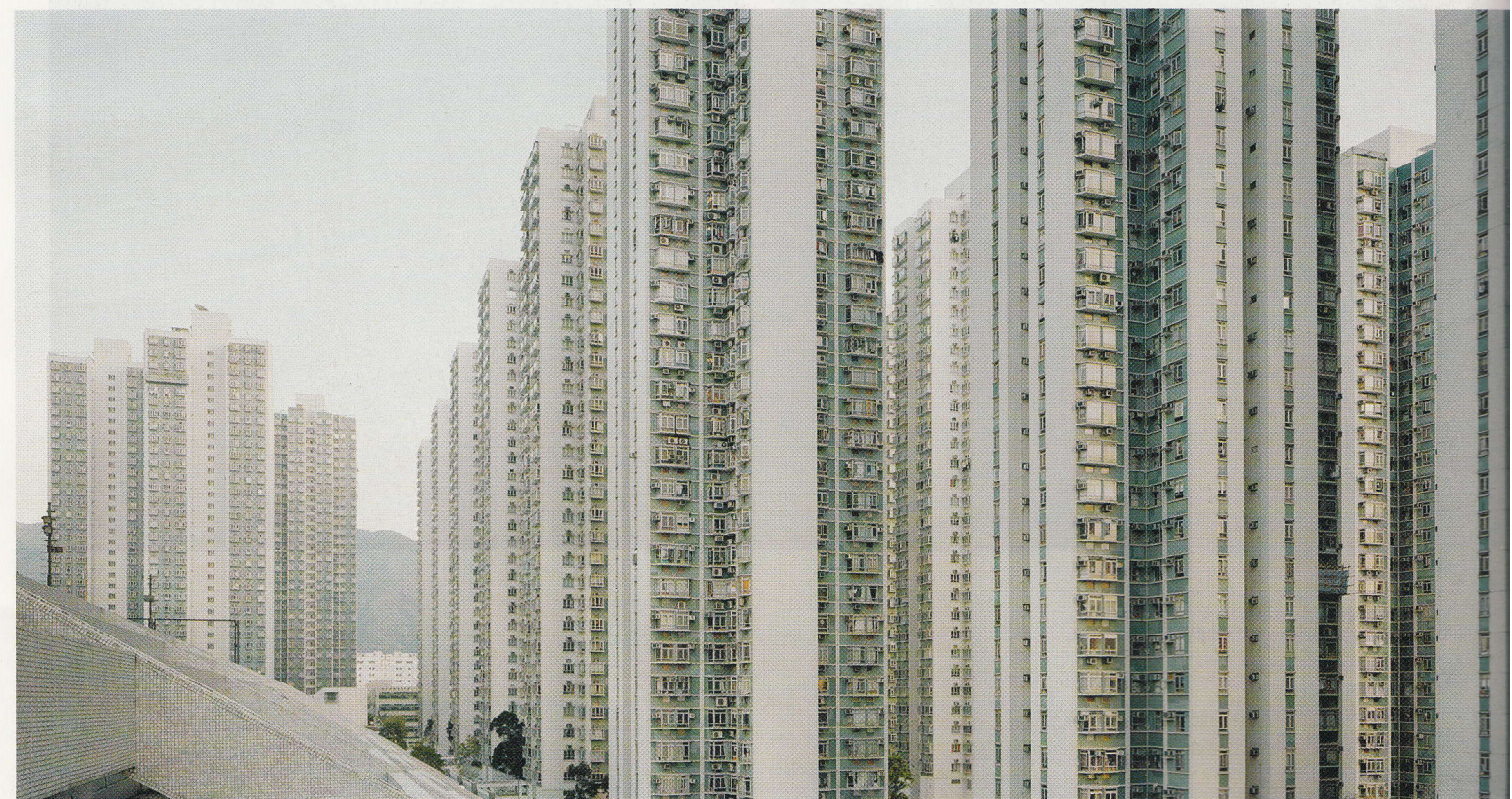
< v City One, Hong Kong, 52 tours identiques, 2011.